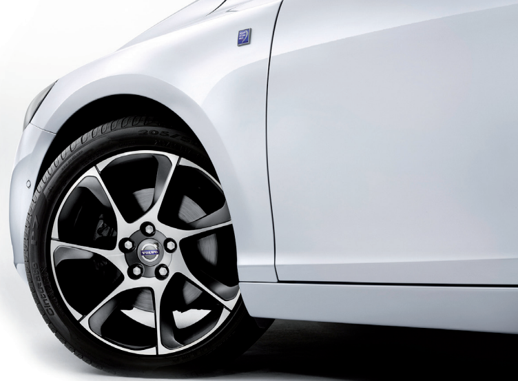
Hertz Car Sharing